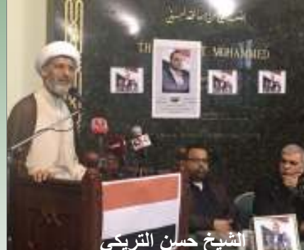
الشيخ حسن التريكي